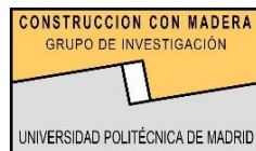
Grupo de Investigación Construcción con Madera, UPM