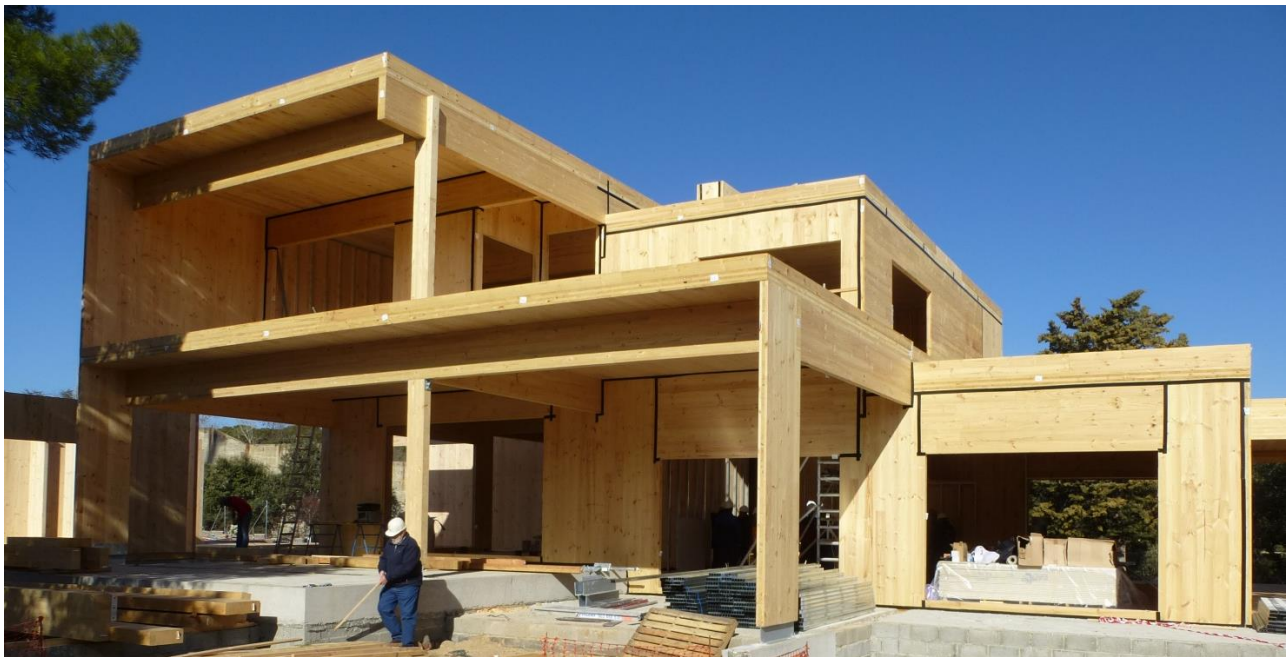
Alcobendas, Madrid (2018)

Grupo de Investigación Construcción con Madera Universidad Politécnica de Madrid