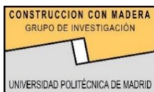
Grupo de Investigación Construcción con Madera. UPM