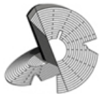
Fundación Conde del Valle de Salazar