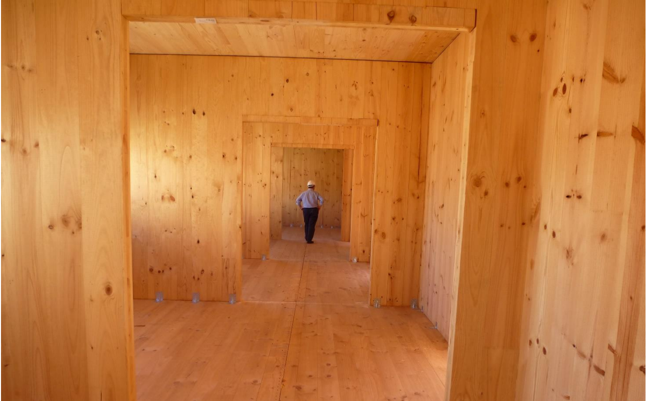
Can Batlló, Barcelona